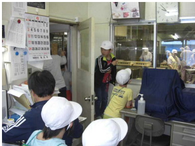
給食センターで調理の見学

2年生は5月31日に給食センター、総合体育館、中学校、保健福祉センターに行きました。