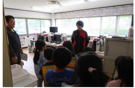
総体の事務室でお話を聞きました

3年生は5月17日に保健福祉センター、7月3日に中和工場へ社会科見学に行きました。