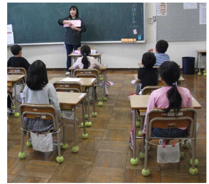
ボールがついた1年生教室

静かな教室づくりのため「廃テニスボールを机や椅子の脚に付ける」作業をしていただきました。