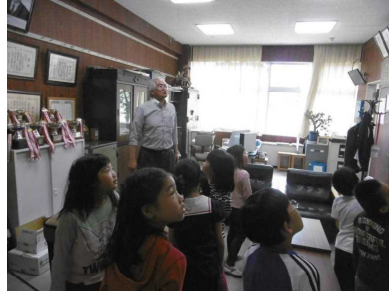
中学校の校長室に入りました