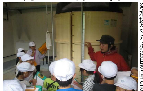
浄水場タンクの役目をお話しました

その後、教室で見てきたこと聞いてきたことを分かりやすく工夫してまとめ発表しました。作品はろうかや教室に掲示してありますので、学校にお越しの際はご覧になってください。