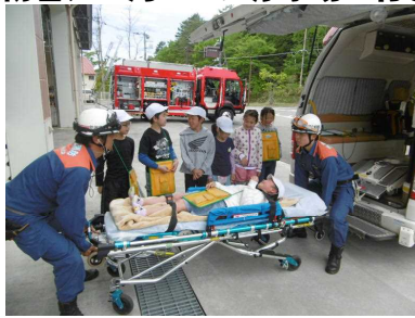
救急車で運ばれる経験をしました