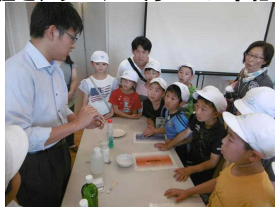
中和工場で川の水の実験