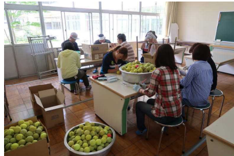
テニスボール設置(子ども一人にボール8個)