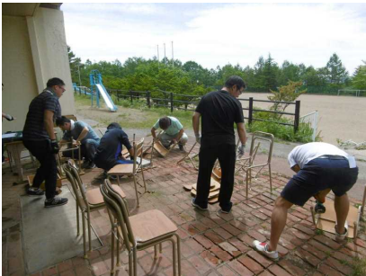
椅子の解体は力仕事