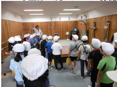
保健センターでいろいろな部屋を見学

3年生は5月17日に保健福祉センター、7月3日に中和工場へ社会科見学に行きました。