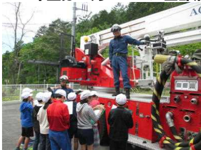
はしご車の迫りにびっくり

4年生は5月21日に西部消防署、7月5日に浄水場へ行き、たくさんのお話を聞いてきました。