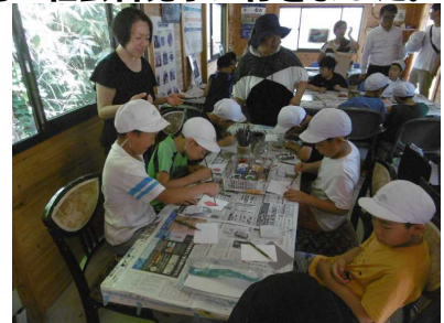
中和工場で百年石を作りました

4年生は5月21日に西部消防署、7月5日に浄水場へ行き、たくさんのお話を聞いてきました。