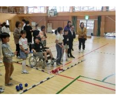
<ボッチャ・車椅子体験>