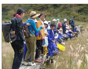
3年生 武具脱の池の見て