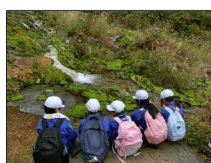
4年生 チャツボミゴケを見学