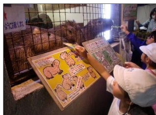
1年生 草津熱帯圏にて

ご協力いただいた草津町・中之条町・草津熱帯圏・ホテルヴィレッジ・芳ヶ平ガイドの皆様、本当にありがとうございました。