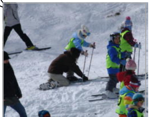
スキー授業 講師・ボランティア

子どもたちが、草津の自然を楽しみながら、体力や集団行動を向上できるよう、よろしく願いいたします。