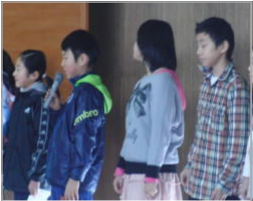
ベルマーク委員会集会