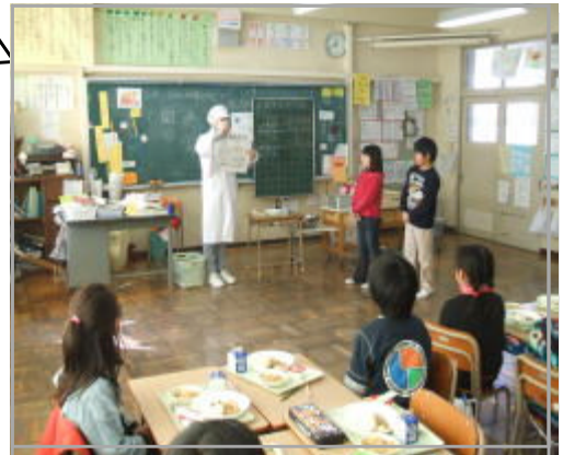
栄養士さんと給食

ご家庭でも、バランスの良い栄養や噛む習慣等にご配慮いただいた食事と家族での会話をお願いします。