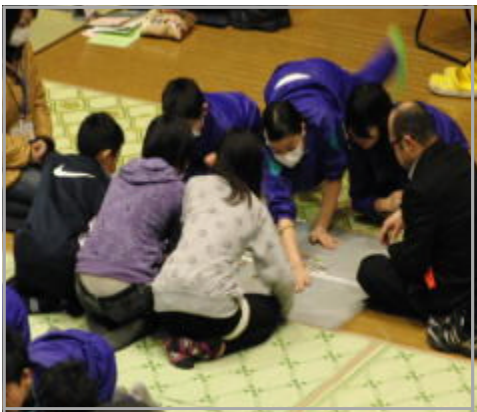
郡上毛カルタ大会(東吾妻コンベンション)