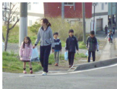
家族みんなで早朝美化(南本町)

この日はきっと気持ちのよい1日になったことでしょう。これからも多くの児童・生徒が参加し、草津町をきれいにしてくれることを願っています。