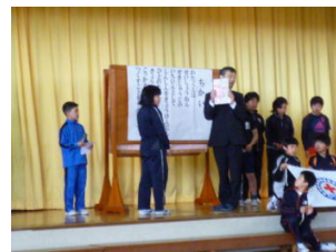
登録書の受け渡し

JRCの精神を身につけた子どもたちになるよう、みんなで取り組んでいきます。頑張ります。