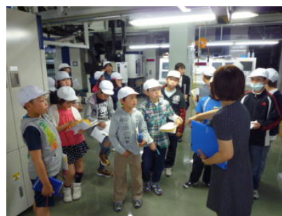
5年生：上毛新聞社見学