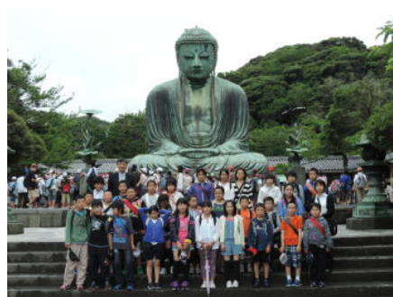
6年生：鎌倉大仏前にて