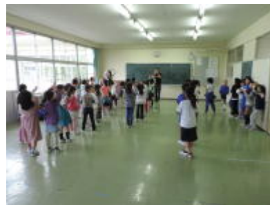
放課後子ども教室〔英会話〕