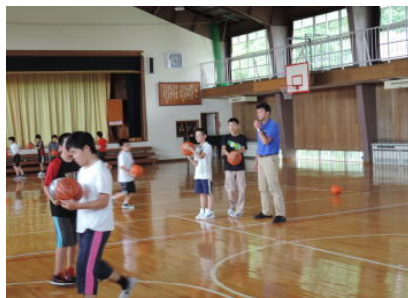
放課後子ども教室〔バスケット〕