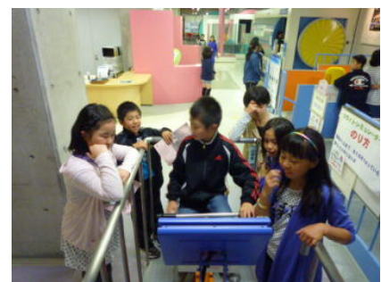
5年生：少年科学館体験学習