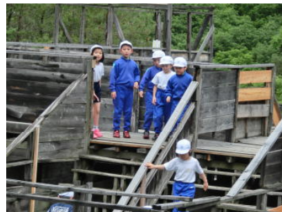
2年生：迷路・西の河原方面