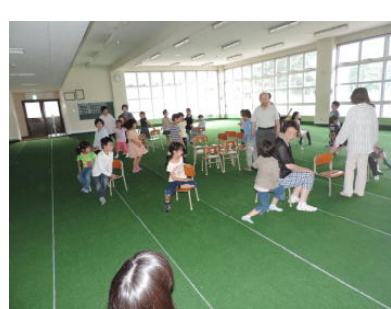
児童室〔老人クラブ第7支部との交流〕