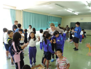
総合(日本の伝統的な遊び)