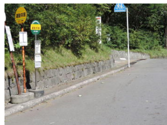
きれいになりました