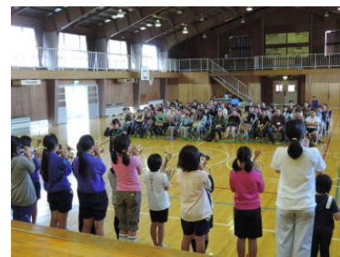
マーチングバンド演奏