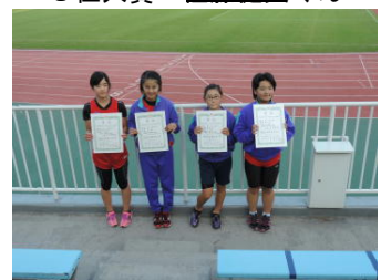
6位入賞・女子リレー

今年度は■■■■■くんが走り幅跳びで、■■■■■さんが 100m で草小新記録を、■■■■■くんが 100 m で草小タイ記録を出しました。