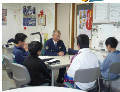
警察官になるには…

先生方は、子どもたちが将来どう成長しているのかを、楽しみにしています。それが先生という職業の魅力の一つかもしれません。