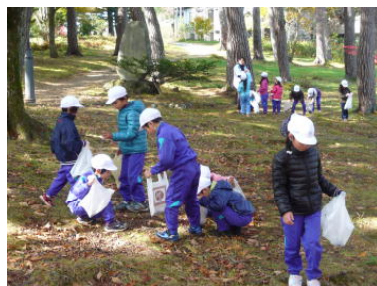
どんぐりがあった！