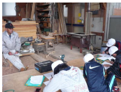
仕事のやりがいは何ですか？