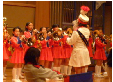
マーチングバンド演奏

マーチングバンド&カラーガーズは、運動会後も練習に励んできました。最近台風の影響もあり、十分な練習もできませんでしたが、夏休みからの頑張りもあり、素晴らしい演奏を披露し、観衆を魅了してくれました。