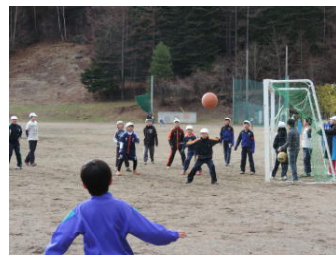
中学年・サッカー