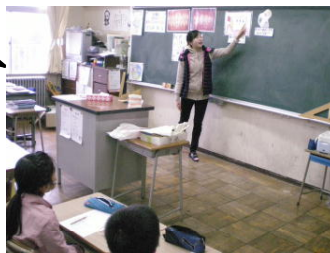
保健の先生との学習

前号でお伝えしたように、本校児童には、う歯の治療をしなければならない児童が多くいます。また、歯肉炎の児童も少なくありません。そこで、3年生に歯肉炎を予防するための学習を行いました。