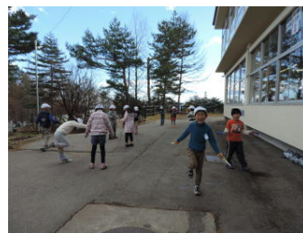
一年生・なわとび

業間体育では学級ごとに長なわにチャレンジしています。朝早くから校庭でチャレンジしている学級もあります。先日の体育委員集会での発表もあり、みんな楽しみながらなわ跳びをしています。3学期にはスキー授業が始まります。丈夫な体になるように「早寝・早起き・朝ごはん」＋しっかり運動を心がけましょう。