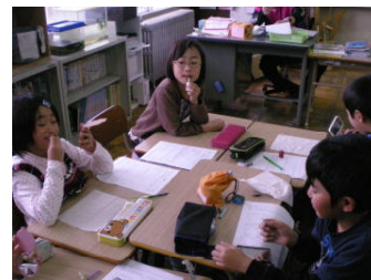
歯と歯ぐきの間に…

歯肉炎とは、歯周病の中でも初期の段階で、歯ぐきに炎症が起きている状態をいいます。その原因となるのが歯垢（プラーク）です。そして、適切なブラッシングで歯垢を取り除くことで簡単に防げるのです。初期段階でのケアで最も大切なのが歯磨き（ブラッシング）です。