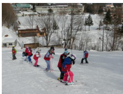
アルペン授業（2年生）