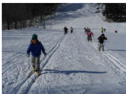
初めてのクロカン授業（3年生）

ジャンプ大会…1月30日（木） クロカン大会…2月7日（金） アルペン大会…2月18日（火）