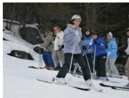
アルペン授業（6年生）