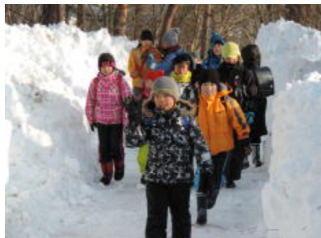
雪の回廊を登校中