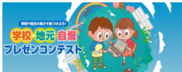
朝日小学生新聞プレゼンコンテスト：ポスター

朝日小学生新聞が主催した上記のコンテストに、本校の特色であるスキー授業で（『学校敷地内でアルペン・クロカン・ジャンプができる！』）応募したところ、全国の1710作品の中から、見事に全国の上位10作品に選出されました。