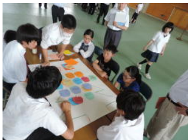
「思いやりが深まる木」作成中

「ありがとう」「がんばってね」が学校に広がり、「バカ」「うざい」がなくなる学校にしていきたいですね。