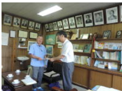
学校評議員会（委嘱状手交）