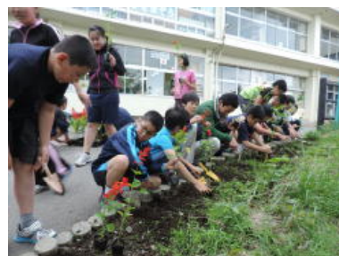
あいさつ坂植栽（6年生）

学校行事や天候不順で、なかなか植えることができなかったサルビアとマリーゴールドを、ようやく植え始めることができました。これから夏に向かってきれいに咲いてくれるでしょう。