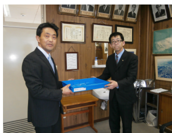
ロータリークラブ 様

入学のお祝いとして多くの記念品(左表)が贈られました。本当に有り難うございました。