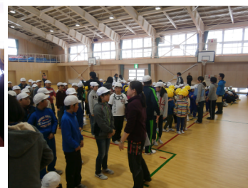
全員の集合を確認中