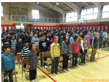
心のこもった校歌斉唱

4月7日(火)は、新任式、始業式、入学式と続き、児童にとっても忙しい一日でしたが、式の中で歌われた数回の校歌斉唱は、その声も大きく体育館の中に美しい歌声が響き渡りました。