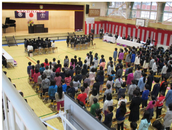
改修された体育館での最初の入学式

1年生は、緊張している様子はあったものの、大きな声で返事をしたり、お礼の挨拶もできたりと、素晴らしい態度で出来ました。また、6年間の良いスタートともなりました。