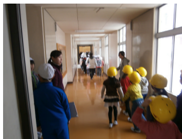
1年生を優先して非難

家庭でも、この地区はどこが避難所なのか、離れた時の確認方法は何かなど、緊急事態を想定して確認をしておいてください。