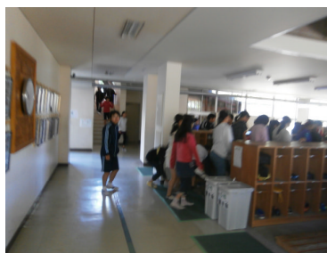
←玄関での避難の様子

また、今回の全校練習の前後に、各学年では、不審者への初期対応としての具体的な避難方法も学びました。