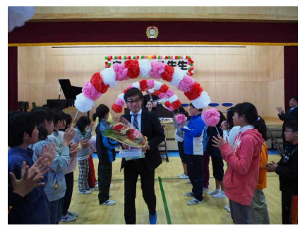
拍手の中でのお別れ