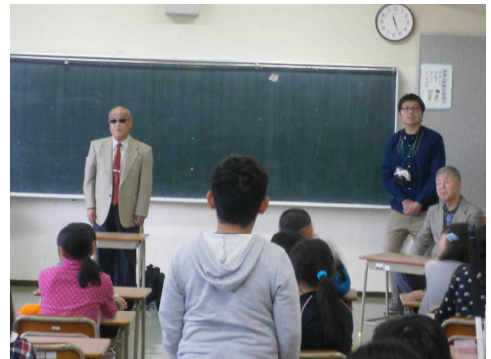
3校時：視覚障害等の話を聴く。

短い時間ではありましたが、障害を持つ方達から聞く「日々の生活の苦労や努力」など、この知識や経験を次に生かしていきたいですね。ご家庭でも話題にしてみてください。