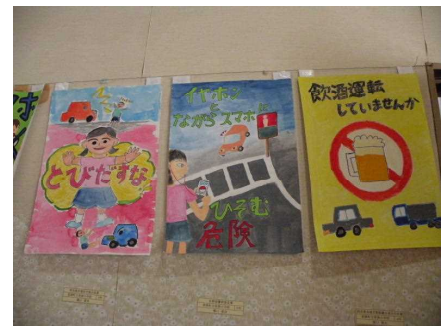
掲示された入賞者の作品！