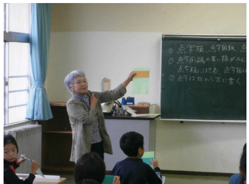
4校時：点字の打ち方を学ぶ。