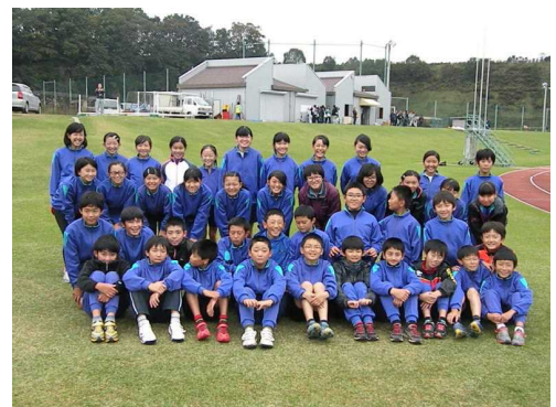
終了後、選手集合。笑顔が輝く！

全員での練習は終わりましたが、マラソン大会以降、保護者の皆様方には、多くの協力をいただき、本当に有り難うございました。