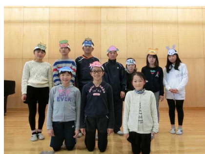
出演者一同が集合！