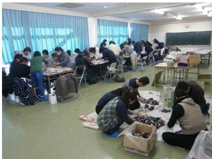
小体育室で作業中！

今年2回目となる「ベルマーク作業」が、12月7日(水)の午後1時から小体育室で実施されました。初めての午後開催で進めましたが、多くの皆様にご協力をいただき、約2時間で終了しました。本当に有り難うございました。