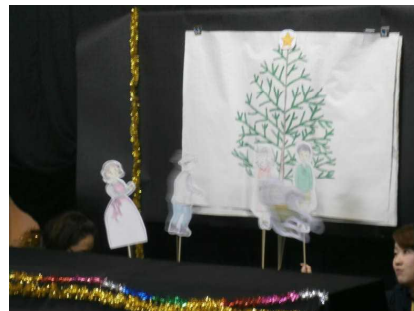
昨年度の様子(4年生)

読み聞かせは、声を通して様々な交流を深めたり心を温めたりする素晴らしい活動です。また、それらを舞台・ペープサート・影絵等を通して効果的に伝えてくれます。時間をかけての子ども達への多くの支援。心より感謝しています。