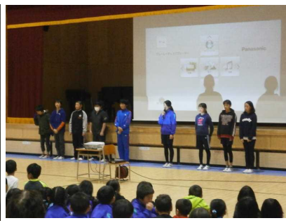
作成関係者一同が集合！