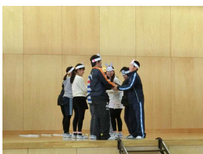
適と味方が仲良く握手！