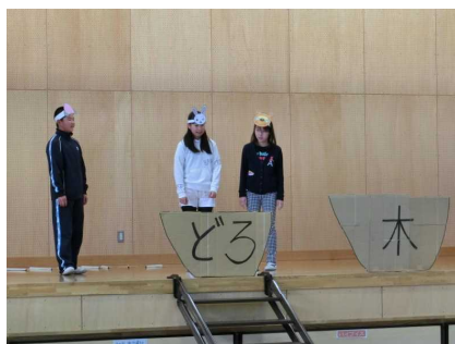
劇が始まる。浦島太郎は？