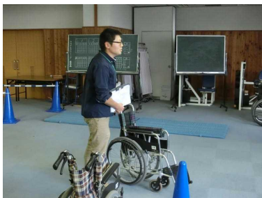
車椅子の構造や操作