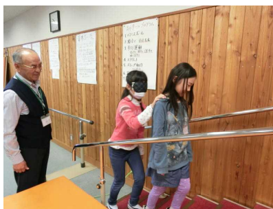
部屋の小階段の上り下り！

まずは、部屋の中の階段の上り下りをペアでやりました。その後、センター内を目隠し体験で歩行したり導いたりするなど、目の見える大切さや誘導の難しさなども体験しました。