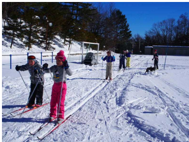
昨年度のクロカン授業

先週、本年度の「スキー授業ボランティア」の募集通知を配布しましたが、11月になり、本年度もいよいよスキー授業に向けた準備も始める時期となりました。クロカン・アルペンでのボランティアに関しては、スキー指導はもちろんのこと、サポート的な支援も不足しています。今年も、多くの保護者の方のご協力をお願いいたします。※事前会議は12月8日(木)に実施します。