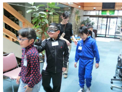
建物の中を移動中！