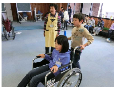
実際に乗ったり押したり！

まずは、車椅子の構造や使い方を教えてもらいました。その後、二人一組になり、乗ったり押したりと、車椅子の大変さを実感しました。また、下りは反対向きであったり、段差には登る際にコツがあったりと、普段知らないことを多く覚えました。