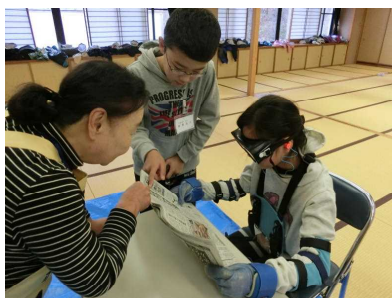
読みにくさを実感！