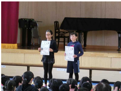
マラソン大会の入賞！