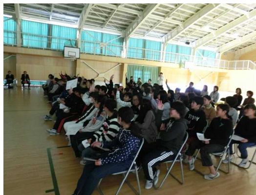
5・6年生と一緒に参加！

児童は、初めて聞くことも多い中、「本人の辛さが分かった。」「自分らしさは大切だ。」など、たくさんのことを学んでいました。