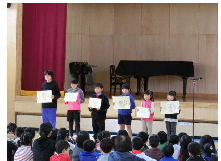
読書感想文の入賞者も表彰！