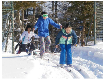
5年生：滑り慣れてます