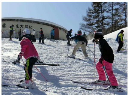
6年②：踏み固めたゲレンデ