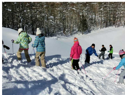
6年①：踏み始めの段階