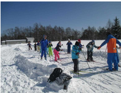
3年生：初めてのクロカン

左の写真の3年生のクロカン授業(水曜)をスタートにして、他の学年のスキー授業も始まり、コーチの方々や多くの保護者の皆様方にも協力をいただいています。児童も、楽しく必死で頑張っています。本格的に始まったスキー授業、多くの皆様方の協力に感謝いたします。