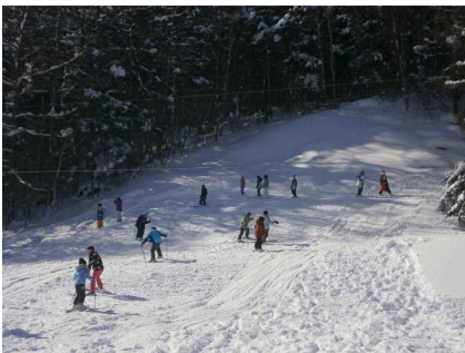
5年：孫天狗ゲレンデ作り

今年も、水曜日の午前の授業の中で、5年生が孫天狗のゲレンデを、6年生が子天狗のゲレンデを整備してくれました。天気も良く、整備には好条件の中、何度も上がったたり下がったり滑ったりと、汗をかきながら、学校の先頭となり頑張ってくれました。本当にありがとう。