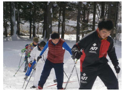
6年生：力強い滑りです