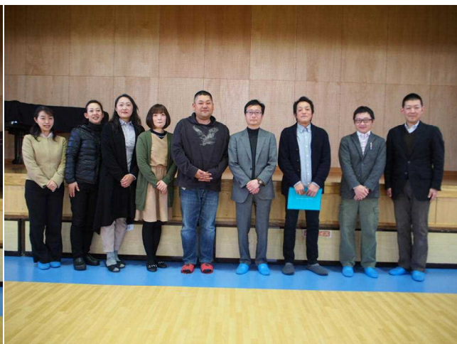
平成29年度のPTA役員(新)。