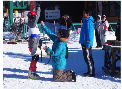
開会式：選手宣誓(天狗山)

皆様のお陰で、スキーに頑張れる「草津っ子」が増えてきていて、本当に嬉しい限りです。