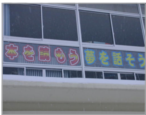
図書室窓表示（本を読もう、夢を話そう）