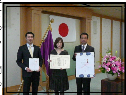
県教委 優良PTA受賞記念