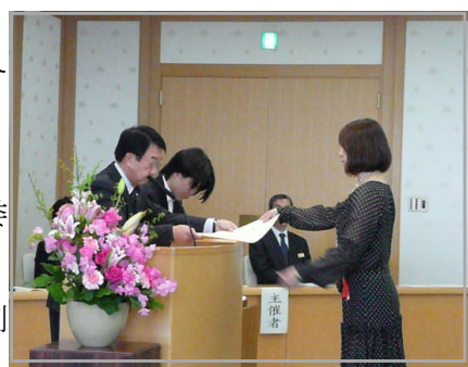
県教委 優良PTA表彰式