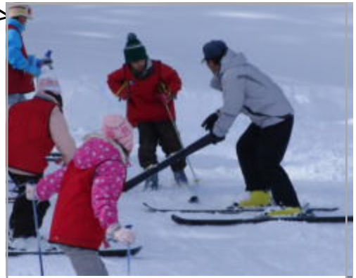
スキー授業ボランティア

低学年の子どもたちは、靴を履くのもたいへんですし、高学年も、斜面で援助が必要な時があります。ボランティアの方々には、大変お世話になっております。ありがとうございます。でも、滑れると楽しそうです!