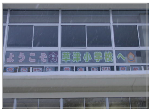
図書室窓表示（ようこそ 草津小へ）