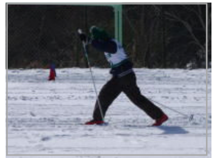
校内クロカン大会