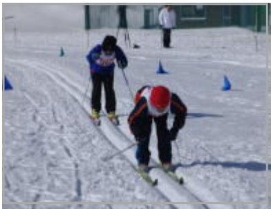
校内クロカン大会