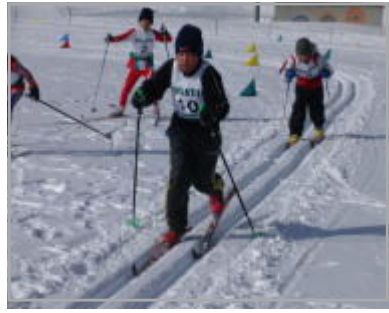
校内クロカン大会