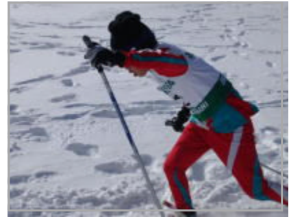
校内クロカン大会