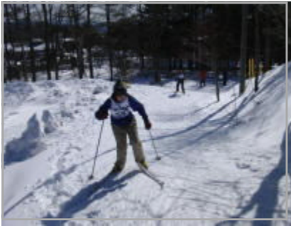
校内クロカン大会