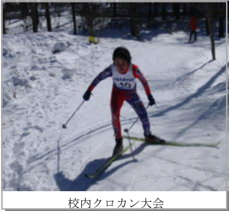
校内クロカン大会

草津町立草津小学校 学校広報 Tel.88-2156 平成23年 2月16日 発