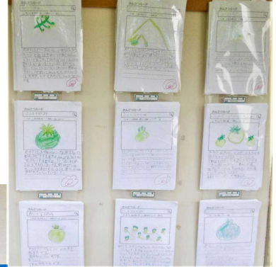
2年生ミニトマトのかんさつ