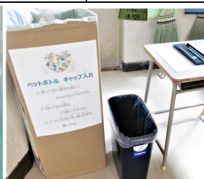
〈キャップ入れは西階段下〉