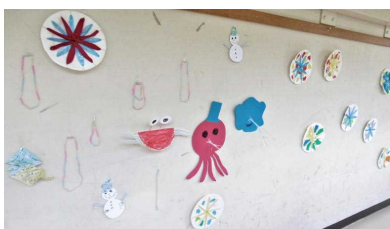
うめ組・ろうかの水ぞくかん