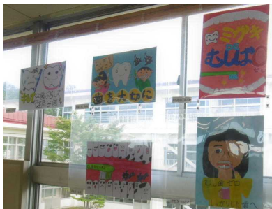
4年生むし歯ポスター