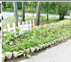
〈環境委員会花だんの水やり〉