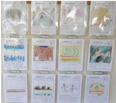
1年生学校たんけんカード