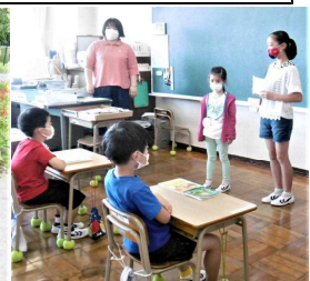
〈保健委員会衛生検査表彰〉