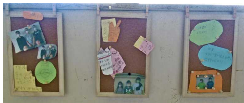
5年生係活動ボード