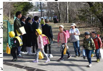
あいさつ運動(草津中生徒会も)

10連休(4/27~5/6)は草津町にもたくさんのお客さんが来て大賑わいでした。子どもたちに連休の生活を聞いてみたら「お家のお手伝いをしました。お留守番をしました。宿題しっかりやりました。」と教えてくれました。お家に人の姿を見ながら子どもたちも精一杯頑張ってくれたようです。また、事故の連絡も無く一安心しています。令和元年!これからも元気で安全に、そしてみんな仲良く生活していきましょう!