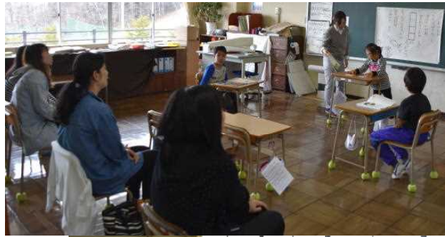
梅組 国語 図画