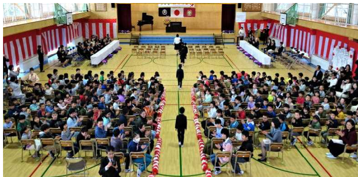
平成三十一年度入学式

令和2年度は新型コロナウイルス感染症対策のため、入学式は新入生と保護者のみで、在校生は代表1名の参加となります。在校生は、教室で「新任式・始業式」の校内放送を聞いた後、新しい担任の先生と学級活動をして、10時頃に下校となります。