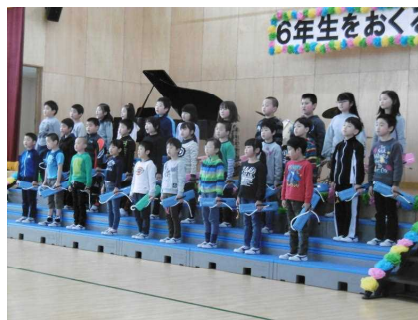
2年生：名文を皆で暗唱