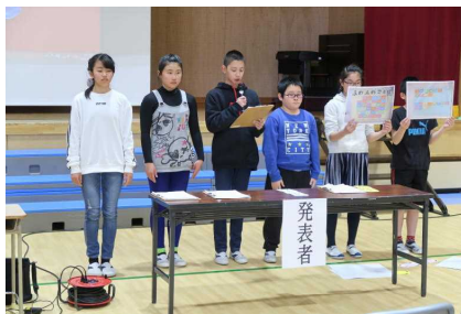
児童会からの活動報告