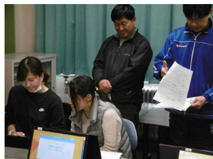
複数の先生で英会話練習