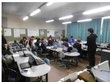
PC教室で研修を受ける

オンライン英会話学習とは、45分の授業の中の30分前後、パソコンを活用した英会話学習であり、画面の向こうにいる英会話講師の指導を受けながら「英会話」を習得していくという内容です。クラスの人数によって班の人数も変わりますが、大体3人の班に1台のパソコンを使いながら、友達と一緒に「英会話」を練習していく学習です。研修会の当日は、学校職員が授業を受けましたが、本物の英会話を身に付ける上では、素晴らしい学習になると感じました。