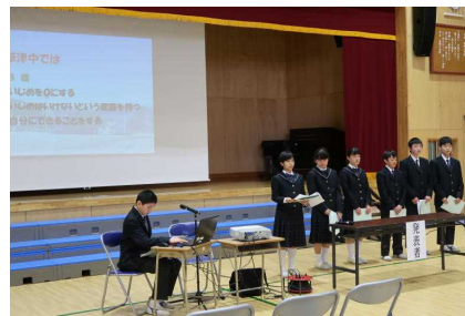
生徒会からの活動報告