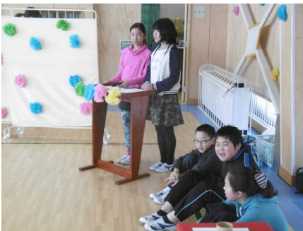
5年生が運営を担当！

今までの6年間で、大きく成長した6年生の頑張りや素晴らしさを感じると共に、改めて、下級生に慕われていた6年生の明るさや優しさも感じ取ることが出来る温かな時間ともなりました。そして、全校児童の「心の成長」を感じる嬉しい時間でもありました。