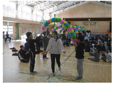
感激・感動の中、退場！