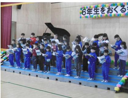
1年生：大きな声で輪読