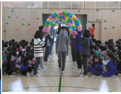
いよいよ6年生の入場！