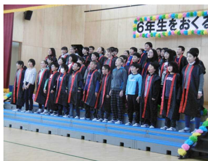
5年生：衣装も揃えて