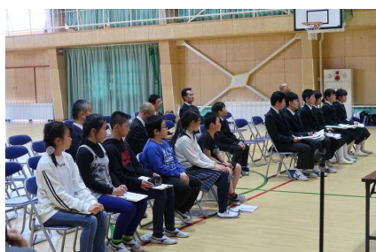
小学校の体育館が会場

今後も、「いじめをしない」「いじめを許さない」等の強い気持ちで、一人一人を大事にした学校生活、楽しい学校生活を過ごせるよう、皆で協力をして進めて行きたいと思います。