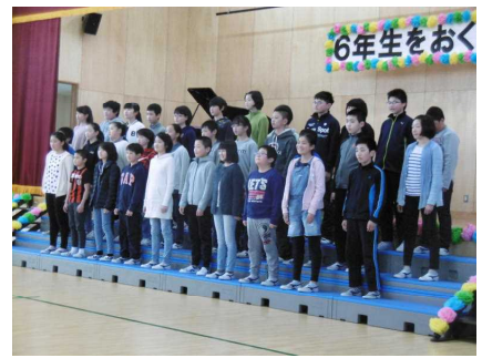
6年生：6年間で振り返る