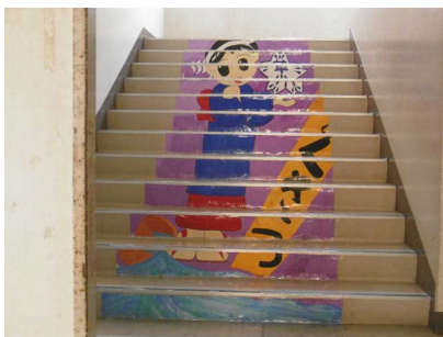
「湯もみちゃん」玄関近く

6年生が2学期に作成した、ステキな「階段アート」の9作品が、全校の関心を引いています。