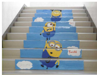
「ミニオン」体育館への階段

白黒の紹介で残念ですが、全てカラー作品です。リアルな表現力の素晴らしさとともに、8班での分担・協力作業も感心しました。