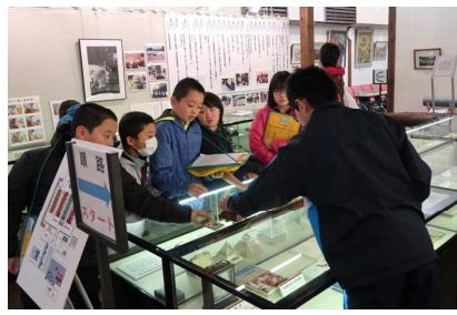
資料の見学・学習①！