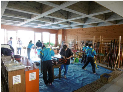
中学生等が整備作業！

お世話になった中学生7名(男子2名、女子5名)は、本校の卒業生でもあり、現在中学校でスキー部に所属して頑張っている先輩でもあります。毎年、先輩である卒業生にお世話になっての整備のおかげで、3学期のスキー授業が実施可能となっております。本当に有り難うございました。