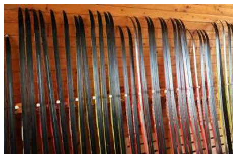
整備されたクロカンの板！