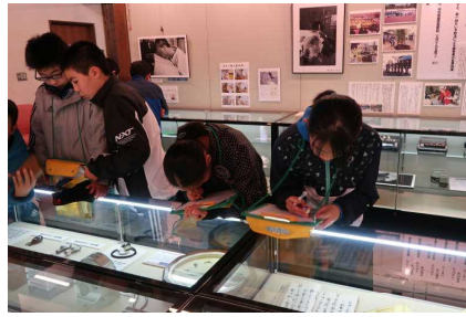
資料の見学・学習②！