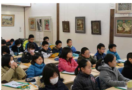
交流会館での学習！