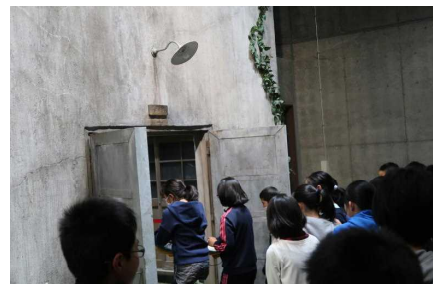
重監房資料館の入口から！