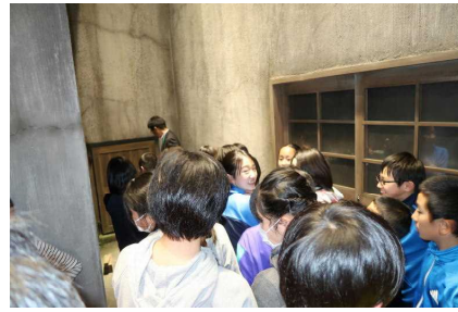
重監房資料館内の見学！