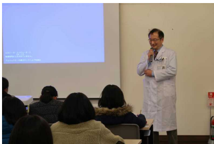
園長による講演中！

地元にある歴史的な施設でもある「栗生楽泉園」。今回の学習を通して、人権の学習を深めるとともに、色々な事を学んだことと思います。