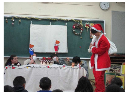
昨年、1年生の会の様子!