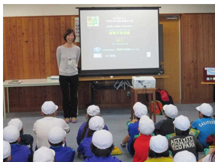
保健センターで学習中!

4回に及んだ4年生の「福祉学習」はこれで終了しましたが、一連の学習を通して、障害や障害者に対して正しい知識を持つと共に、適切に行動することにも結び付いたと思います。