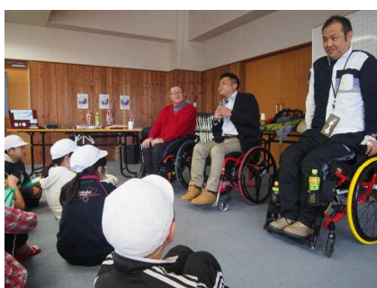
直接、お話を聞いてます!