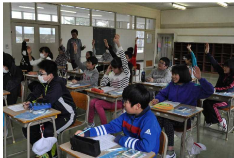
税金やその使い道を学習中！