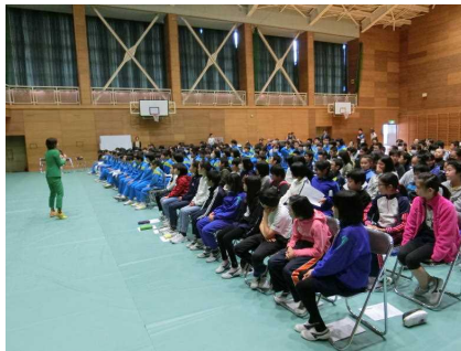
小学生は左側に着座！