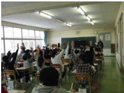
会場は小体育室にて！

11月22日(水)の5校時には、草津町法人会、吾妻法人会の合計9名の方にお世話になり、「租税教室」にて、税金に関する多くのことを学習しました。DVDによる税金の大切さの学習。10問クイズを活用した納税のことや税金の使い道の学習。また、憲法に表現されている「納税