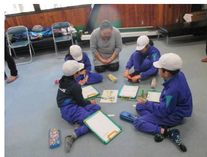
深く考え、意見を交換!