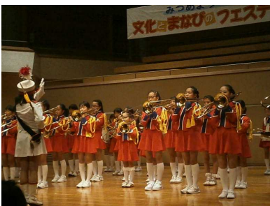
迫力ある演奏でした！

10月28日(土)に開催された草津町の「芸能発表会」に、今年も、マーチングとカラーガードが参加してきました。10月に入ってから、放課後の練習も再開し、音を合わせたり動きを整