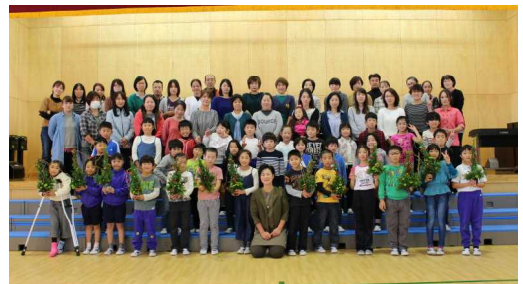
1クラスとなつての集合写真！