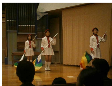
堂々と演技できました！

えたりと、毎日遅くまで練習してきた成果を発揮して、当日は、素晴らしい発表となりました。