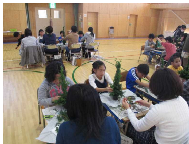
工夫を重ねて作成中！