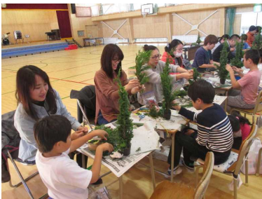
相談しながら作成中！

3年生の親子行事は、まずは、体育館で「フラワーアレンジメント」を実施しました。作成した物は、来月に向けた「クリスマスツリー」でした。親子で話し合い、様々な材料を色々と工夫を重ねながら作成していました。力を合わせて作成した綺麗なツリーは、一生の思い出・宝物になったことと思います。その後、体育館での給食も、和やかな雰囲気の中で楽しい会食となっていました。1クラス(35人)になって最初の会食ですが、人数の多いことに改めて気付かれたかとも思います。お忙しい中、本当に有り難うございました。