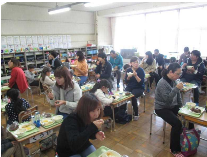
楽しく美味しい親子給食！

その後、一緒に「熱の湯」まで行き、楽しみにしていた「湯もみ体験」。ザスパの選手も一緒になっての親子での「湯もみ」は、思い出に残る体験になったと思います。また、全国でも有名な「湯もみ」の体験は、貴重な経験になったと思います。本当に有り難うございました。