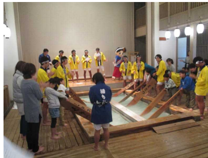
待ちに待った湯もみ体験！