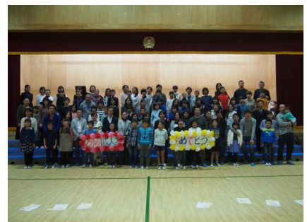
1/2成人式の記念写真！