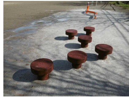
ラバーステップ：跳び台