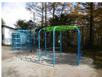
円形雲梯：トライアルダー

昨年度から取り組んでいる校庭の整備等が更に進みました。古くなっていた遊具を2つ撤去し、下記の3種類の遊具を設置しました。ジャングルジムの隣(円形雲梯)と、撤去したタイヤ跡に2種類を並べて(写真参照)設置しました。早速、多くの児童が活用してくれて、嬉しい限りです。