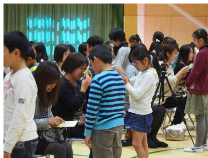
感謝の気持ちを言葉で！