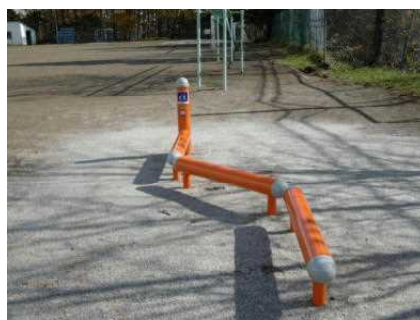
ビームラン：横跳び越し機