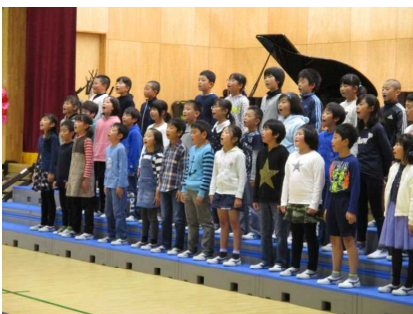
全員で歌の贈り物！

4年生の親子行事は、恒例となっている「2分の1成人式」でした。体育館を会場にして、将来の夢の紹介、歌のプレゼント、御礼の手紙の読みなど、盛り沢山の内容で、児童の成長を感じると共に感動の気持ちで溢れていました。児童の成長を一緒になって振り返ることで、10年間の頑張りを確認すると共に、親子の絆もより深まったと思います。その後の親子給食も話がよりはずみ、美味しい給食となったはずです。様々な協力もいただき、本当に有り難うございました。