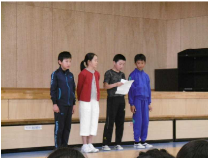
安全委員による呼びかけ！

学校の「あいさつ坂」では、毎朝、元気な声でのあいさつが響き渡っていますが、これからも今まで以上に元気なあいさつが聞こえてくることと思います。