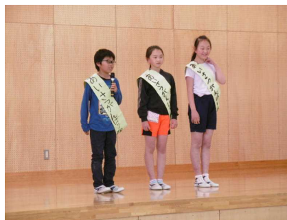
あいさつがんばり隊！