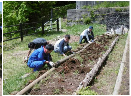
花壇の修復も完成間近！