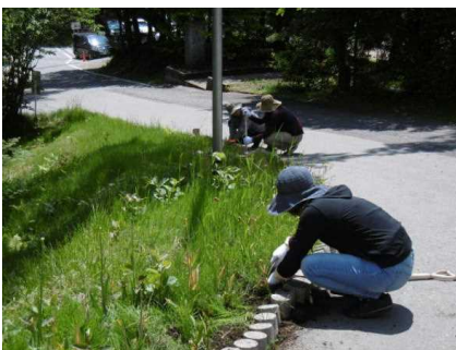
テストピースの並べ直し！