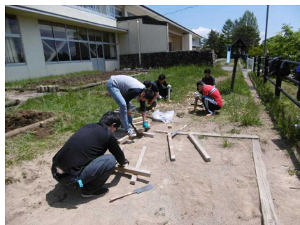
丸太をおさえる杭作り！