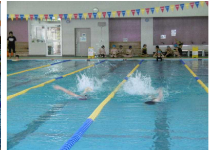
高学年の力強い泳ぎ！