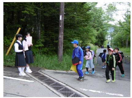
当日の朝は、中学生も！