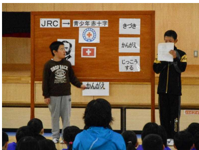
児童会役員からの説明！

5月18日(木)の業間には、毎年実施している「JRC(青少年赤十字)登録式」を体育館で行いました。始めに、児童会の本部役員が、「JRC活動等の説明」「態度目標(気づき、考え、行動する。)の寸劇による説明」を進めた後、各学年の代表児童が、登録の署名をしました。