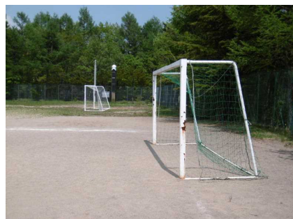
これで2組となりました！