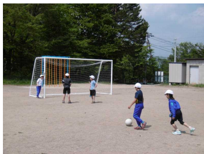
休み時間に早速活用！

月曜日の放課後、先生方で協力して設置したところ、火曜日には多くの児童が授業や業間等で喜んで使ってくれていて、購入して良かったと思いました。これで、2組のサッカーゴールが揃ったことになり(大きさは同じです。)、ゴールを複数のチームが共有することも減るかなと安心しています。これも皆さんの協力のお陰と、心より感謝しています。