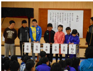
各学年代表者による署名！

草津小のスローガンの中に、「やさしさ」という言葉がありますが、その言葉にも関連して、優しさの「目・耳・感覚」で気付いたことに、自分から進んで行動できる人になって欲しいと思いました。