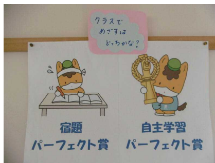
各頑張り賞の紹介