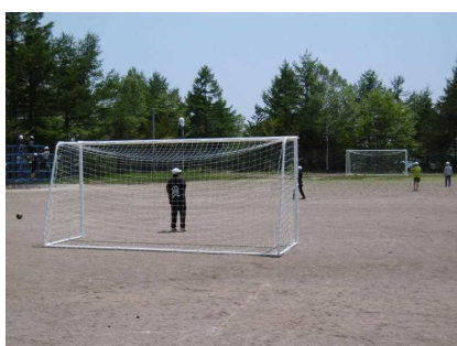
校庭の東側に設置！