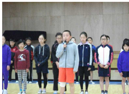
代表(星野君)のあいさつ