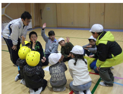
班別での確認・相談活動