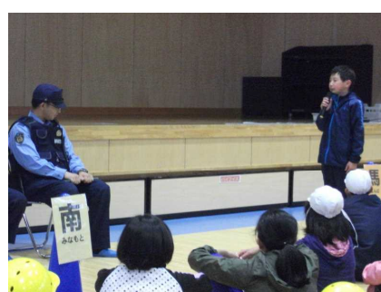
閉会：安全委員長より御礼