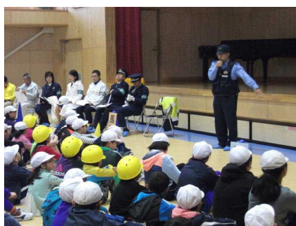
開会：交番所長の話