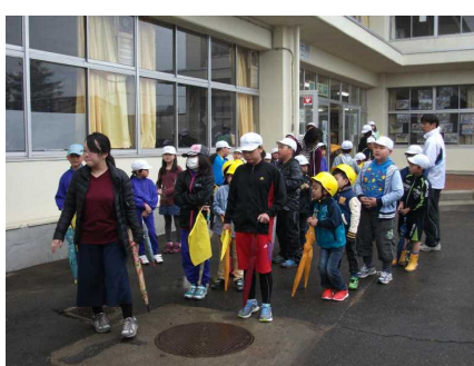
玄関前から練習開始