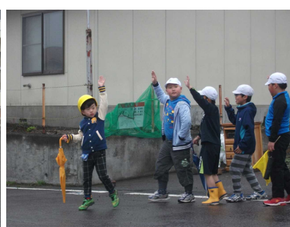
左右の確認をしっかりと