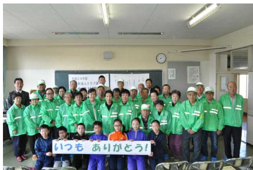
本日(朝)の「安全祈願集会」にて！

本日朝8時より、安全守り隊の方々を小体育室にお招きして、本年度の「安全祈願集会」を開催しました。