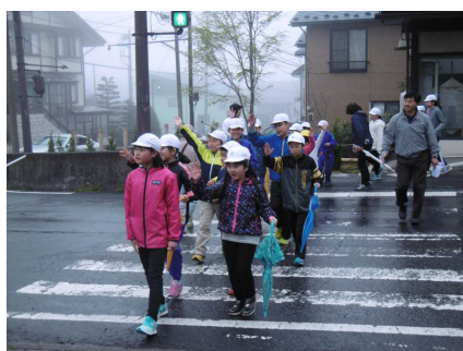
櫻井前の交差点を横断中